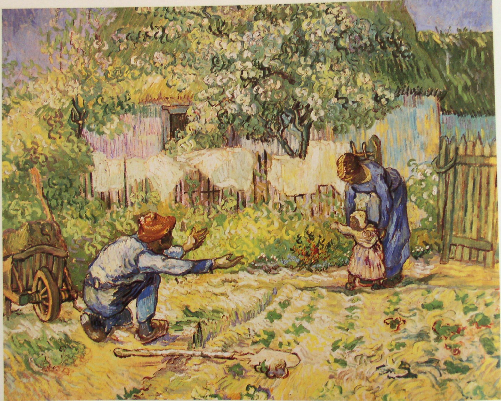
Vincent Van Gogh. Les premiers pas de l'enfance. 1890.